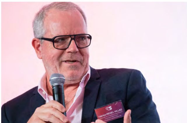
(09/12/25) Conférence Citoyennes du Sport 2025 dédiée à la santé mentale / Conference dedicated to mental health

« La performance collective passe par la possibilité donnée à chacun de se sentir bien, stable et en confiance »