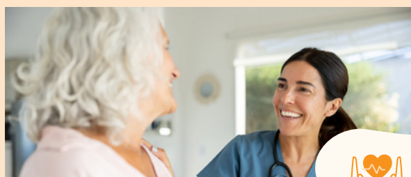
Domaine des soins