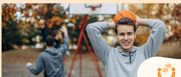
Adolescent-e-s et jeunes adultes