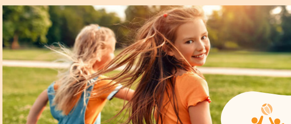
Enfants et familles