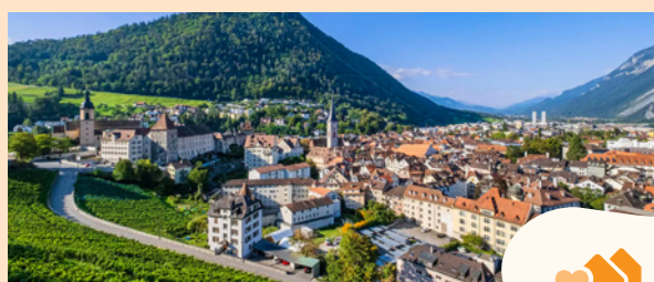
Communes et villes