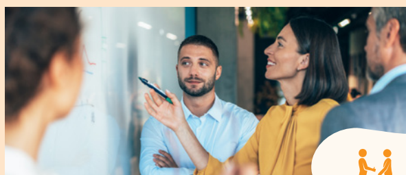
Monde du travail